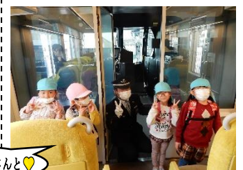
特急ラビューの 運転手さんと♡