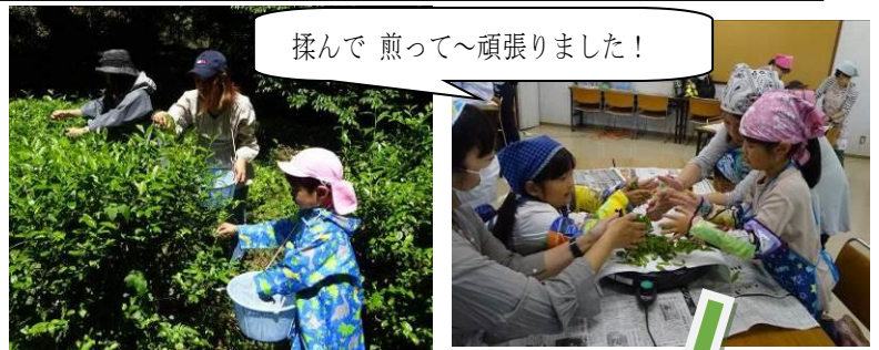
揉んで 煎って～頑張りました！

親子で茶の新芽を摘み、摘んだ葉を蒸し、ホットプレートの上で、親子で揉む、煎る作業を行い、茶葉を作りました。出来た茶葉は急須に入れ、一煎目、二煎目、三煎目を味わいました。自分達で作ったお茶の味は、香り渋み旨み甘味…をしっかりと味わい、親子で素敵な体験をすることができました。